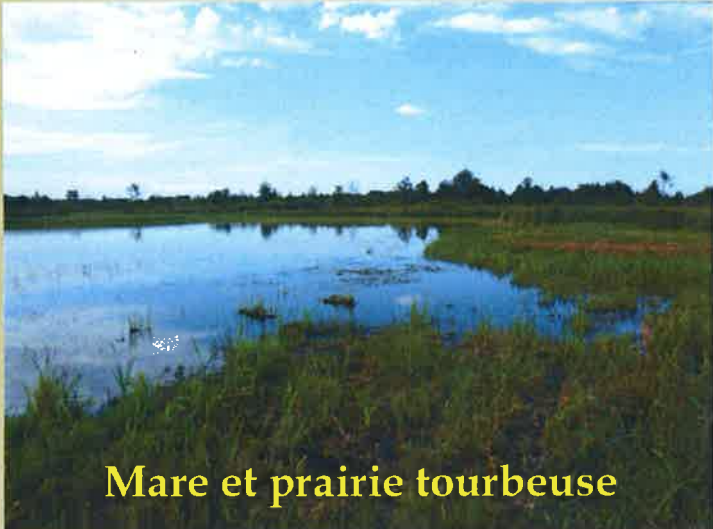
Mare et prairie tourbeuse

Ce marais communal est constitué de deux zones d'habitats très différents :