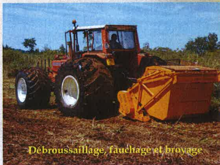
Débroussaillage, fauchage et broyage

Les broyats ont été évacués vers une zone de stockage pour ne pas enrichir la zone traitée. Ils ont été plus tard exportés chez un agriculteur pour amender un sol de culture. Les engins étaient munis de pneus larges pour éviter la formation d'ornières.