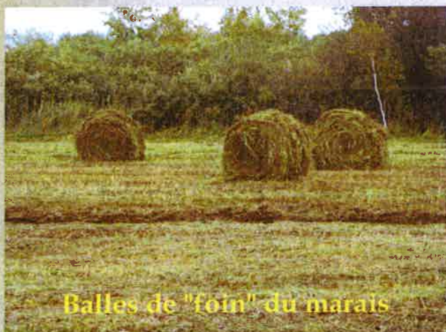
Balles de "foin" du marais

Les années suivantes ces mêmes zones ont été simplement fauchées, les balles de « foin » ont été exportées vers le marais du Conseil Général pour nourrir le troupeau de bovins camarguais en hiver.