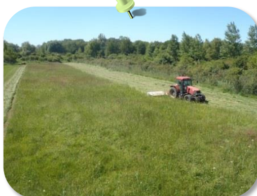
Travaux de fauche d'une prairie humide