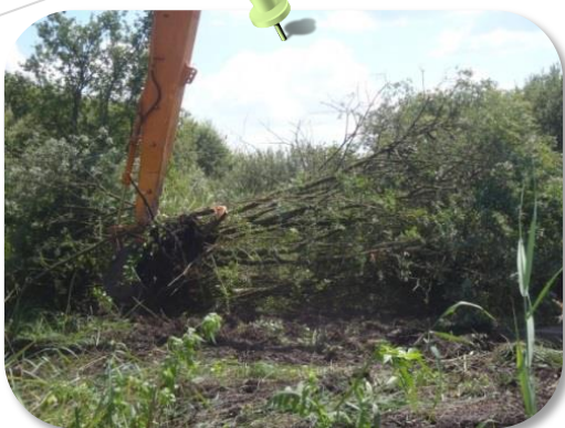
Travaux de déboisement par arrachage essentiellement de saules