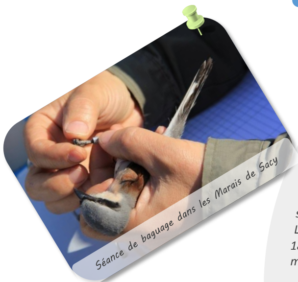
Séance de baguage dans les Marais de Sacy

Les Marais de Sacy constituent une voie importante de migration entre le Bassin Parisien et le Plateau Picard pour l'avifaune. Situé sur un axe Nord/Sud pour les migrateurs transsahariens, les Marais de Sacy représentent une zone de repos et de nourrissage. De plus, la présence de milieux originaux, comme les grandes roselières inondées et les prairies humides, permettent la nidification d'espèces typiques des zones de marais, dites paludicoles. C'est pourquoi, la Station Ornithologique des Marais de Sacy est implantée depuis 1972 et travaille en étroite collaboration avec le Muséum National d'Histoire Naturelle de Paris. Elle recueille des informations sur les différentes espèces d'oiseaux présentes sur le site, l'évolution numérique de ces populations et sur leurs déplacements. La station joue ainsi le rôle d'observatoire de la faune aviaire des marais. 180 espèces d'oiseaux ont ainsi été comptabilisées pendant ces phases de migrations et plus de 110 espèces y nichent. On y observe l'évolution et la régression d'espèces en fonction de la dynamique des milieux et du changement climatique.