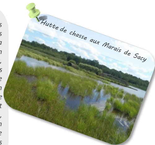
Hutte de chasse aux Marais de Sacy