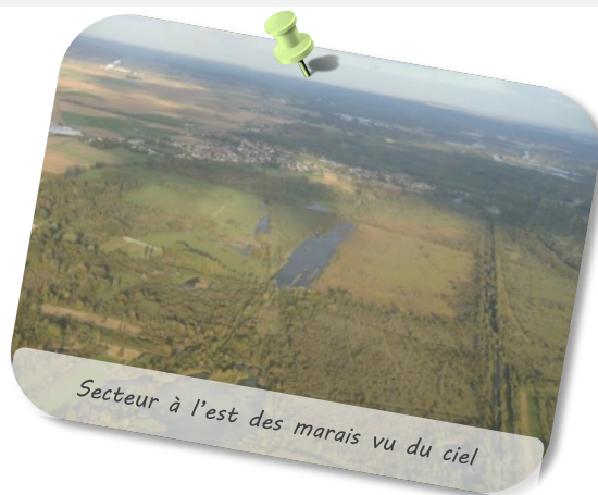
Secteur à l'est des marais vu du ciel

Les Marais de Sacy comprennent un certain nombre d'habitats naturels et d'espèces notamment animales qui relèvent de la directive européenne habitats, faune et flore et de la convention Ramsar. Ils ont été de ce fait retenus dans la liste des sites que la France a présentés à la Commission européenne pour intégrer ce vaste réseau de sites européens Natura 2000 et présentés à la labellisation Ramsar. Les Marais de Sacy sont officiellement site Natura 2000 depuis 2010 et zone humide d'importance internationale au titre de la convention Ramsar depuis 2017.