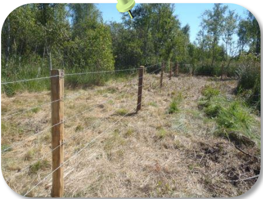
Travaux de pose de clôtures pour du pâturage extensif d'entretien