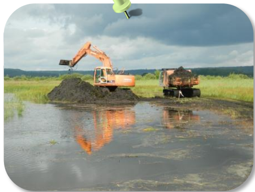
Travaux de curage d'une mare de chasse